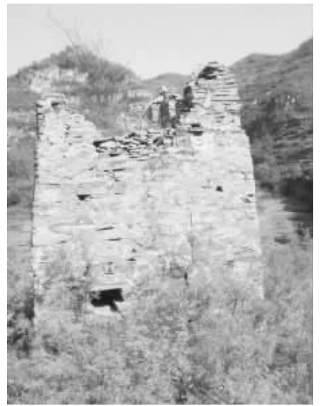
从隘口残存的凉沟桥墩台可知彼时墩台的形制。

从隘口残存的凉沟桥墩台可知彼时墩台的形制。墩台,古时用于军事通讯的报警设置,在不同的历史时期,对其有着不同的称谓。