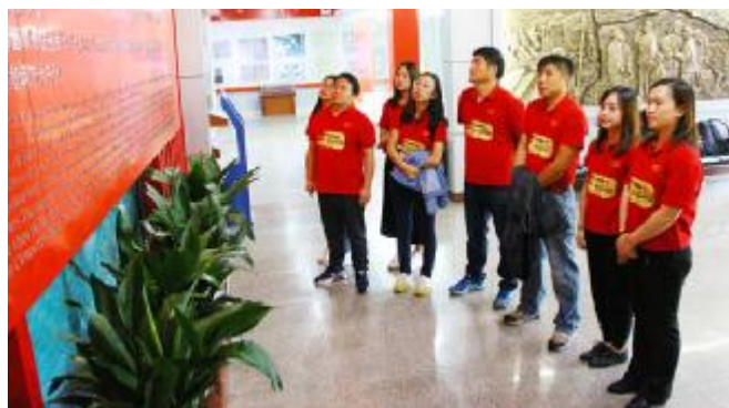
图为,“重走长征路”车队队员参观纪念馆。

思革命先烈。随后,在红军渡广场,苍溪县城郊中学的百名学生在小雨中齐唱《强军战歌》,并在“致敬历史、重走长征、不忘初心、继续前进”万人签名”上写下了自己的名字。车队一行还参观了红四方面军长征出发地纪念馆,馆内保存着大量的革命文物,还有模拟渡江场景。在馆内陈列的大刀、枪支、手榴弹等红军使用过的武器,以及大量的石刻标语,都生动展现了红军曾在这里的战斗经历。