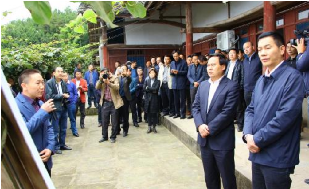
图为,与会人员到陵江镇六包村参观猕猴桃基地建设及改土建园现场点,并听取相关推进情况汇报。

张寿于说,今年以来,我县猕猴桃发展好事连连,猕猴桃产业发展被列入全县十件大事全力推进;建成中国猕猴桃交易中