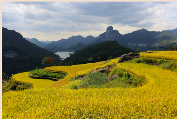
丰收季节