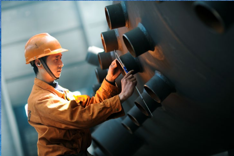
《精于丝 细于毫》华光锅炉 缪奇