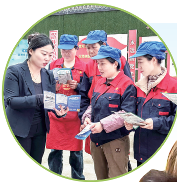
4月5日,农银人寿河南分公司南阳支工作人员走进南阳一滴香油食品有限公司,向企业员工普及金融知识,宣讲普惠金融政策。