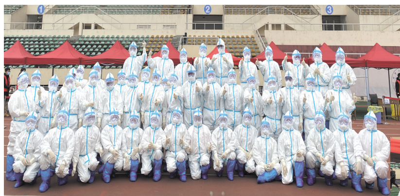
大邑赴郫都支援医护人员