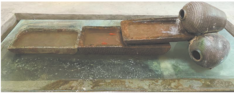
▲斜源小镇共享中心里,村民过去养猪用的食槽和瓦缸组合颇具特色。

新生的小镇引来更多投资客。以“旅居+主题精品民宿”为主导,投资20亿元的“春上六坪”项目落地斜源,打造文创民宿、云上树屋等;还有投资2亿元的“半山小院”村宿聚落群、投资1亿元的“探花·邸”高山设计师聚落,投资5亿元的“杏林山居”精品林盘民宿等多个亿元级项目聚集于此。“从聚景到聚人再到聚项目,价值转化是篇大文章,只有让乡村的价值真正发挥出来,才是让乡村真正活起来。”先桃说。