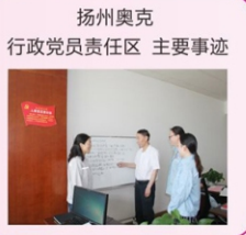
扬州奥克 行政党员责任区 主要事迹

接待效果 优：接待工作是一个复杂的系统，加强组织领导和统筹协调是做好接待工作的关键。作为公司行政部门，在接待工作中起到了主导作用。在每次大大小小的接待任务筹备工作阶段，为确保接待工作的科学合理运行，行政党员责任区的各位党员主动联系协调接待部门，组织安排好接待工作，力求做到“无缝衔接”，取得了良好的接待效果。