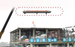
及尾部支撑连接点都最佳对接，标志着反应器吊装作业取得圆满成功。(广东奥克 陈志成)

会后，完成阀门调整和安装等准备工作后，下午正式进入反应器吊装工序，大家按部就班，做好每一项准备工作。反应器在地面完成水平定位后，吊车将反应器缓缓吊起，平稳地移动到接受器和反应器平台上方。正当反应器继续接近接受器准备就位时，天开始下雨了。经过一个多小时的冒雨作战，终于实现了在反应器和接收器的法兰面连接点、中部支撑连接点以