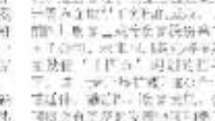
中日合资企业沈阳帕卡裁精一行到访奥克包装