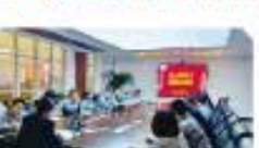
新员工座谈交流会