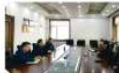
奥克集团风控法规部到辽阳石化企管法规部学习交流