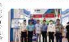
奥克包装参加电池技术交流会