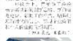
辽阳区域首次‘联合’召开第一季度安委会会议