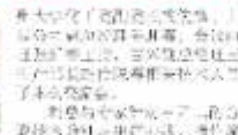
徐州公司召开三乙二醇分离提取技术交流会