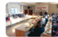
奥克包装全体员工合影。

美好的新年祝福送给全体员工及员工家属，同时也要感谢一直以来支持公司发展新老客户。2024年希望大家凝聚力量，迎难而上，再创佳绩。