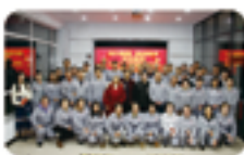
吉林奥克全体员工合影。

本报讯 12月29日下午三点，广东奥克员工与相关单位齐聚城市中心东汇城奥克福园，参加2023广东奥克年会盛典。