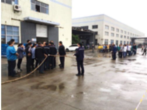
BU1 VS 供应链