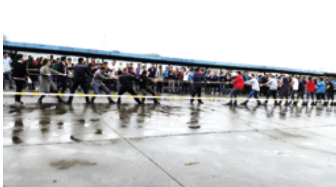
BU1 VS ME