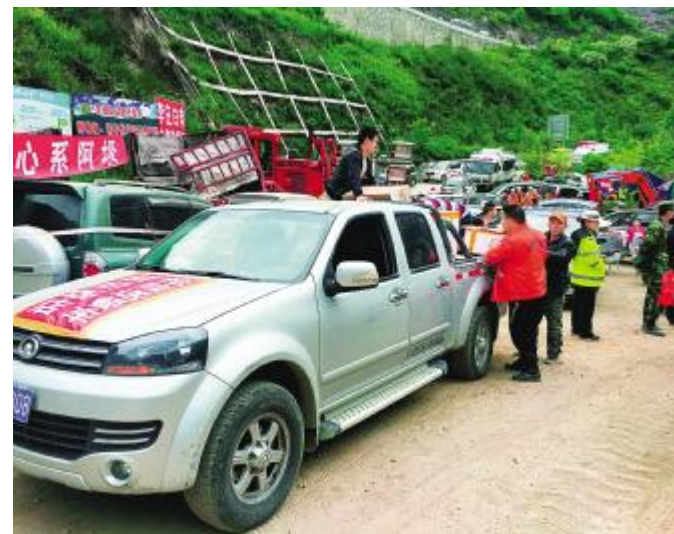
四川省阿坝藏族羌族自治州茂县“6·24”特大山体滑坡灾害发生后，救援人员连续奋战在抢险救灾一线，不少当地群众自发为他们送饭，用这种朴实的方式表达感谢之情。图为6月25日，茂县当地群众将饭菜送到抢险救灾一线。