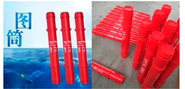
1. 图纸自然卷装于图筒内； 2. 图筒选择同一规格竖向摆放；

工程图纸作为建筑工程的重要依据，在项目建设环节起着非常重要的作用，那么项目图纸管理就应该得到重视。针对施工现场图纸堆放杂乱，使用时图纸不好找，存放时图纸丢失、污染、破损等现象，特提出改善图纸存放及便于查找使用的措施。该装置可以多次周转使用。