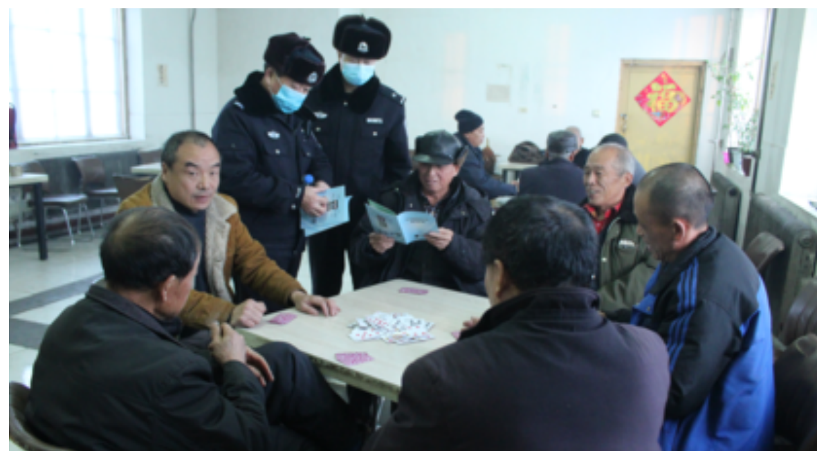
连日来，内蒙古大兴安岭森林公安局库都尔分局中心派出所民警通过发放宣传材料、现场讲解等方式，在辖区老年活动中心、商业网点、学校等地段开展防诈骗宣传活动。图为民警在老年活动中心发放宣传材料。