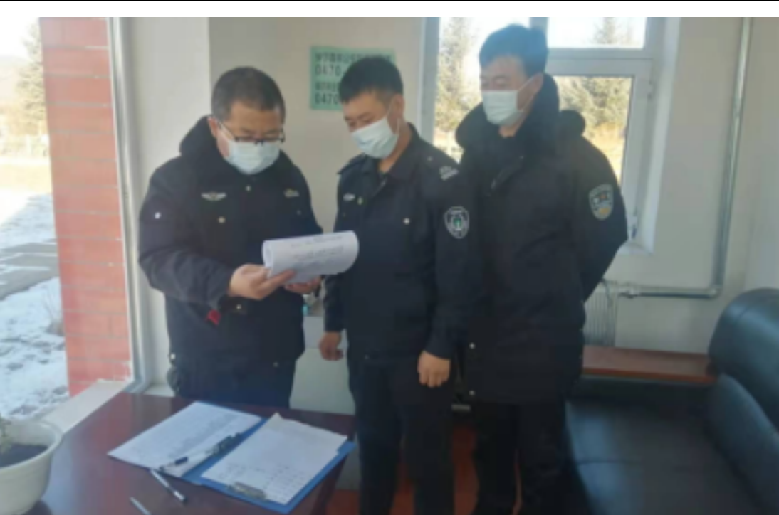
近日，绰尔森工公司森林资源管理处抓好疫情防控工作，对管辖的8个综合管护站(检查站)进行消杀，并对过往车辆及群众进行登记检查，做到早发现、早报告。图为检查车辆人员登记情况。

庭情况清、困难原因清、帮扶需求清。根据帮扶对象的具体情况，制定帮扶计划和帮扶措施。同时，他们从解决帮扶对象实际问题入手，在职工“最急”上见真情，在特困职工“最需”上求突破，帮助符合条件的职工家庭享受相应的帮扶政策，在资金、生活和工作上关心帮助帮扶对象。