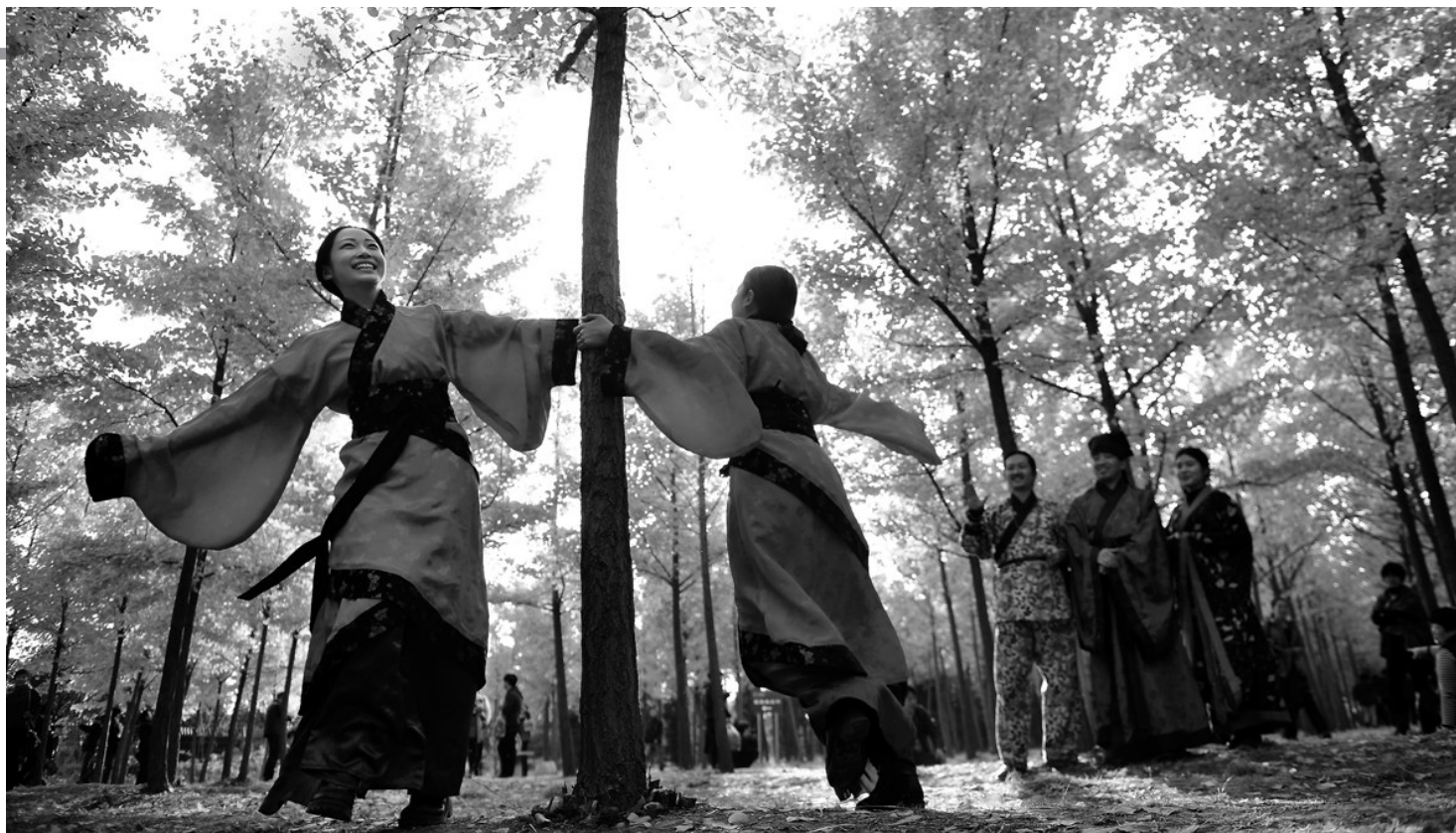
《秋色醉人》 作者 刘强

笔墨吐秀竞风雅,光影流霞存菁华。10月25日三秦都市报记者获悉,经过精心筹备,由汉景帝阳陵博物院主办的“醉美阳陵”摄影展在该院正式开展,此次展出的60幅(组)作品充分反映了汉阳陵景区秋冬季银杏林美景、人文景观,体现了积极向上的精神风貌,具有浓郁的自然人文色彩。