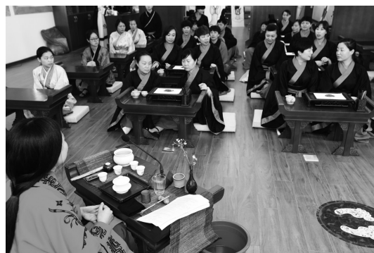
《汉阳陵下授“茶课”》 作者 袁景智