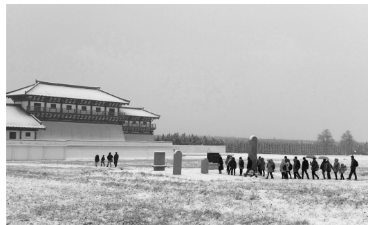
《阳陵之冬》 作者 覃文民