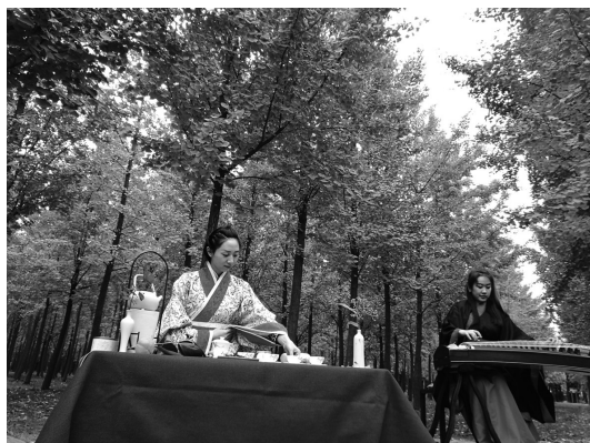
《汉风茶韵》 作者 李明