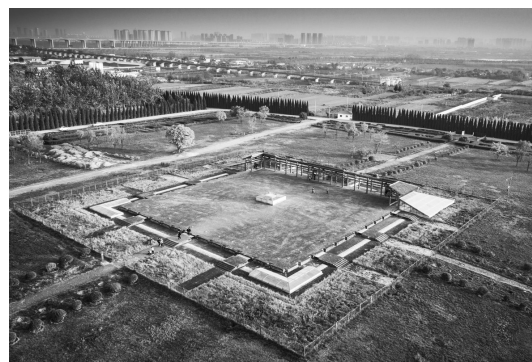
《鸟瞰汉阳陵宗庙遗址》 作者 李念

2013年12月30日,习近平总书记在主持中共中央政治局第十二次集体学习时提出,要系统梳理传统文化资源,让收藏在禁宫里的文物、陈列在广阔大地上的遗产、书写在古籍里的文字都活起来。此次“醉美阳陵”摄影展的举办就是认真贯彻落实习近平总书记的指示精神,充分发挥文物资源在传承发展中华优秀传统文化中的作用,加强公共文化服务,盘活文物资源,激活文物生命力,资政育人,惠及公众。 本报记者 赵争耀