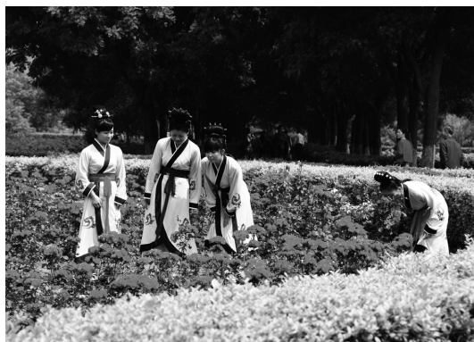
《穿秋》 作者 兰伟