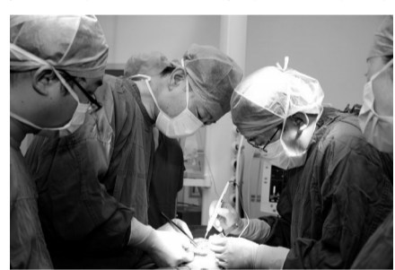
儿童外科进行高难度手术

回首岁月,岁月无声;检点业绩,民心有碑。西安交大第二附属医院经过80年的建设发展,几代人的艰苦卓绝的奋斗,医院现有15个临床学科系,4个教研室,设有临床医学博士后流动站,临床医学为一级学科博士点,硕士学位授予点全覆盖。医院设有53个临床医技科室、专科病房和研究室,拥有数量众多的国家重点学科和国家临床重点专科,其中泌尿外科、皮肤病专业为国家教育部医学重点学科;骨外科、消化内科、临床专科护理、地方病科(地方性骨病、心肌病、碘相关及甲状腺疾病)、麻醉科、皮肤科、呼吸内科、耳鼻咽喉头颈外科、急诊医学