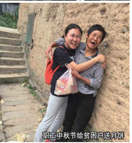
职工中秋节给贫困户送月饼