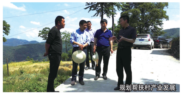
规划帮扶村产业发展

0.42万亩农田受益。加强农田水利建设,新建雍水堰17座,新建渠道107条共72.5公里,新增、恢复灌溉面积2.1万亩,惠及9个贫困村,1271户贫困户,贫困人口3871人。依托中小河流治理项目支持脱贫移民搬迁安置点修建堤防4.68公里。