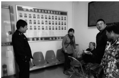
等驾坡派出所民警救助迷路老人