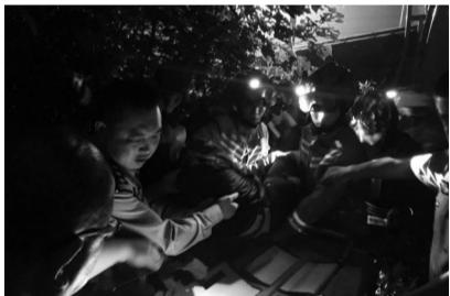
昆明路派出所民警营救侧翻货车司机

此时,就在民警向网友们“报平安”时,短短一个小时内关注这件事情的网友达7000余人,当得知已经找到孩子的家人时,网友们纷纷为民警点赞。