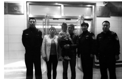
长延堡派出所民警为走失女孩找到家人