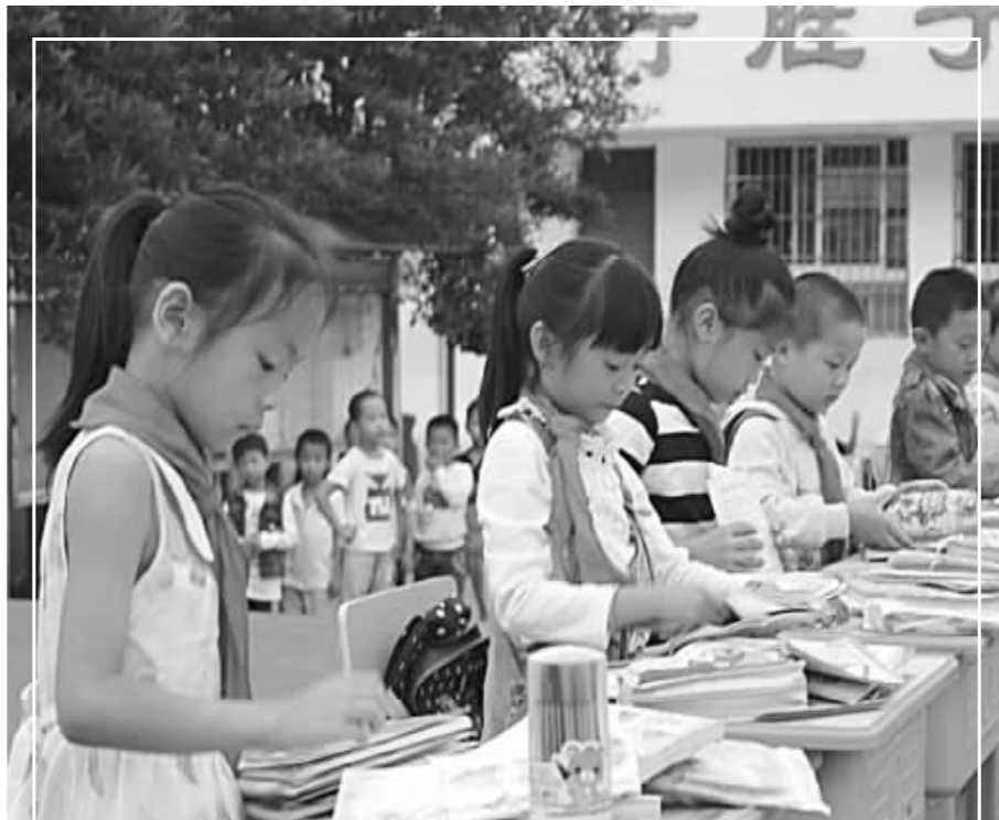
为督促学生们养成一个有序整理书包的良好习惯,近日,德兴市海口中心小学举办了低年级学生“整理书包”大赛。