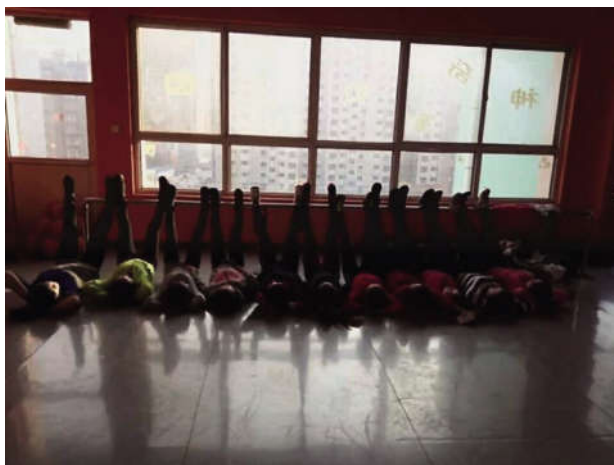
图为幼儿园老师个性合影

小仙女: “环境,咱们这儿的团队氛围很好,整体学习氛围很浓,大家的时间观念都很强,这一点让我觉得非常不错。而且幼儿园这两年在牛园长的带领下,也在不断的创新发展,我觉得只要跟着集团公司,以后一定会越来越好的!”