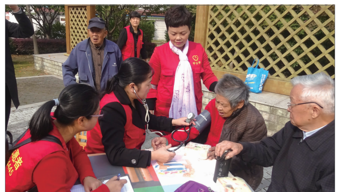
近日,我区手拉手志愿者协会的志愿者们来到西城街道小南门社区,开展志愿服务,与该小区的老人们共度温馨时光。志愿者们还为老人们量血压并建立健康档案。