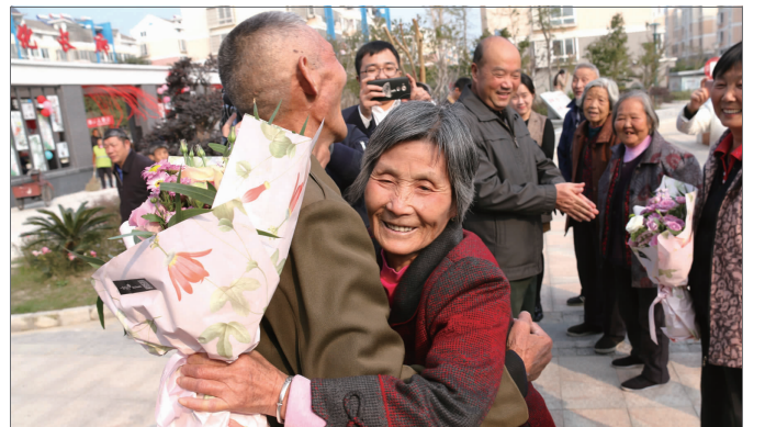
10月27日,东城街道华胜社区开展“我们的故事”重阳节主题活动,活动邀请了9对结婚30年以上的老夫妻,通过颁发另类“结婚证”,分享他们的故事,形成全社会敬老、爱老、助老的良好风尚。图为一对老夫妻在接受献花后快乐拥抱。