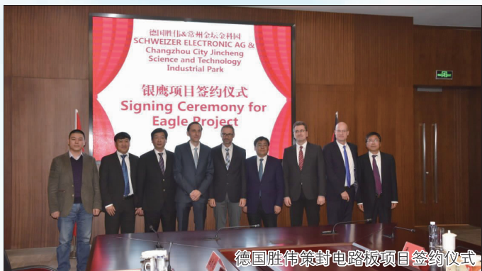
德国胜伟策封电路板项目签约仪式