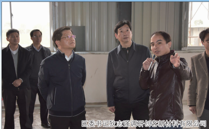
区委书记狄志强调研创客新材料有限公司