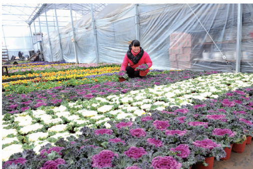
江苏省如皋市顾庄村村民在恒温大棚内整理待售花卉。