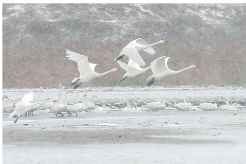
位于江苏中部的盱眙县龙庙湖,栖息在这里的野生天鹅在雪中飞翔、嬉戏,灵动的身影为雪后的湖区增添了一份别样的韵味。