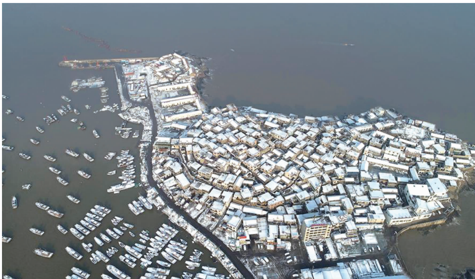
掩映下景色迷人。江苏省连云港市连岛渔村在大雪