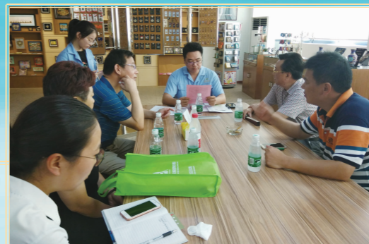
上门为企业提供服务