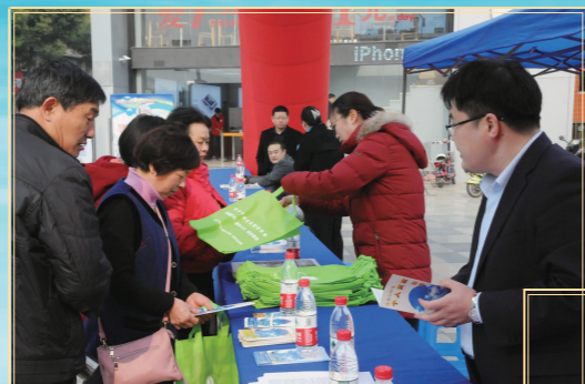
在市民广场开展政策宣传和咨询解答活动