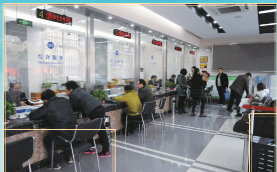
金坛分中心服务大厅整洁明亮