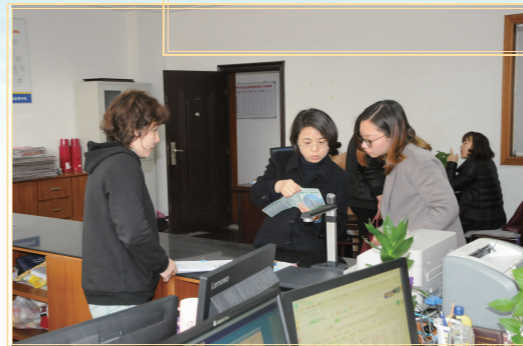
为镇(街道)工作站提供指导