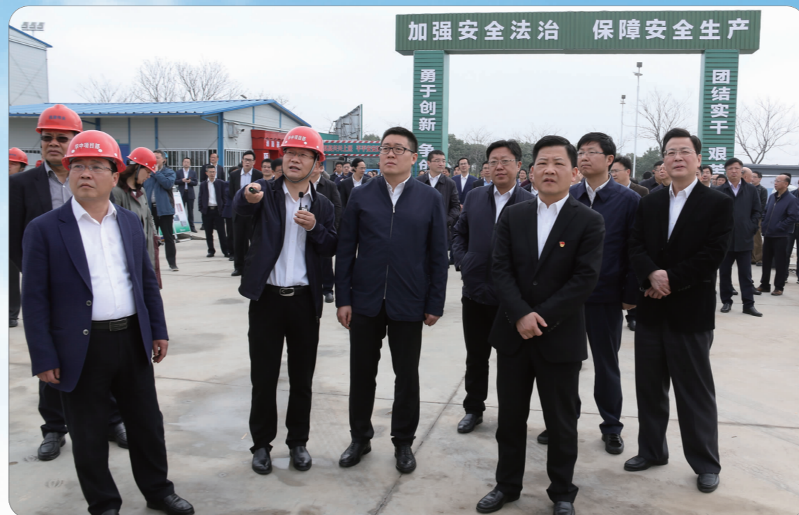
区领导在华罗庚中学滨湖校区听取项目介绍

阳能电池,5GW高效太阳能组件,可使电池效率达到22%的世界领先水平,同时将电池组件寿命从25年提升到30年,产品质保从10年提升到20年。预计可日产100万片电池和1万块组件,实现年销售110亿元以上,新增4000余个就业岗位。 李蕾