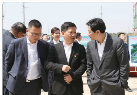
区领导在金博众创园督查