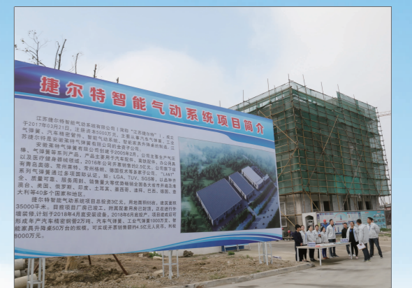
捷尔智能气动系统项目现场

我区围绕两个加快,依托各工业集中区,引进一批机械零部件、汽车零部件等产业,不断完善产业配套,拉长产业链条。江苏捷尔智能气动系统项目总投资3亿元,目前厂房已竣工,4月底安装设备,6月底投产。项目建成后可形成年产汽车精密钢管2万吨、汽车气弹簧、工业气弹簧1000万支、智能家具升降桌50万台规模,实现开票销售约4.5亿元。利和新能源汽车零部件项目总投资2亿元,建成后将形成年产1500万套新能源汽车用电动压缩机配件、年产3亿件汽车空调配件及1000万套电子水泵水阀配件规模,项目达产后可实现年销售3亿元。常州睿阳机械有限公司主要从事汽车及工程机械零部件等产品研发与生产,产品主要销往日本、墨西哥及国内上汽集团。项目总投资1.2亿元,于今年3月开工,12月竣工投产,预计实现年产量2.5万吨,年销售3亿元。常州卡夫迪机械有限公司“农用机械设备生产”项目总投资8000万元,去年8月开工建设,今年8月竣工,项目投产后可年产2万台农机设备,实现年销售1.5亿元。常州泉阳汽车科技有限公司精密机械零部件、汽车零部件项目总投资1.5亿元,建成投产后可形成年产30万件汽车零部件能力,实现年销售收入3亿元。