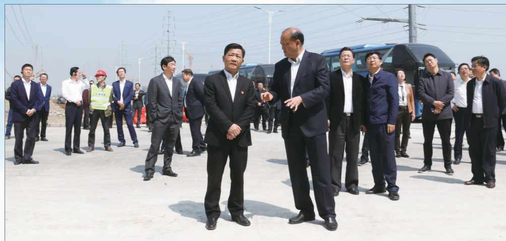
区领导现场查看 S240 改造提升工程