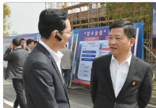
区领导在卡夫迪项目现场督查