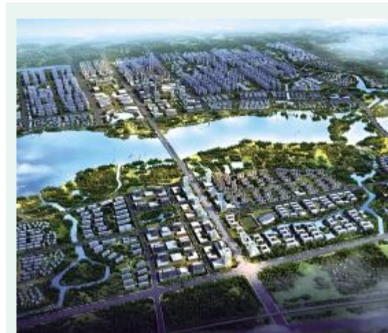
以新发展理念为引领,建成一个20万居住人口、交通便捷通畅、居住环境舒适、生态环境优美、公共服务配套健全、市政设施配套齐全、商业服务配套完善的现代化新城,成为金坛未来城市的新中心,成为金坛未来发展的新名片,成为金坛百姓宜居宜业的幸福城。

滨湖新城区域内有一天然内湖——钱资湖,与金沙老城一路之隔,地理位置十分优越。目前钱资湖北区征迁、清障工作已全面完成,北区主次道路网已全部建成,开发条件十分成熟。