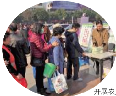
开展农产品安全宣传

第七,严厉打击违法违规行为。全面推行农业综合执法,强化农产品质量安全监管执法。加强农业投入品生产经营和农产品生产、收购储运、屠宰、批发、零售等重点环节执法检查,严厉打击制售假劣农资、生产销售使用禁用农药兽药、非法添加有毒有害物质、收购销售屠宰病死动物、注水、私屠滥宰、虚假农产品质量安全认证、伪造冒用“三品一标”产品标志、不执行国家粮食质量标准的收购和储存等违法违规行为。建立农产品质量安全案件协查、产销监管等协调联动机制,强化农业行政执法、食品安全监督执法与刑事司法的有效衔接,加大案件查办和惩处力度,案件移送率达到100%。加强案件查处信息通报,及时曝光有关案件。健全应急处置机制,妥善处置突发应急事件。严格执行食品安全举报奖励制度,加大宣传力度,营造打假维权良好社会氛围。方案同时明确实施步骤和保障措施,今年7月份做好总结和迎检工作,确保高标准通过验收。