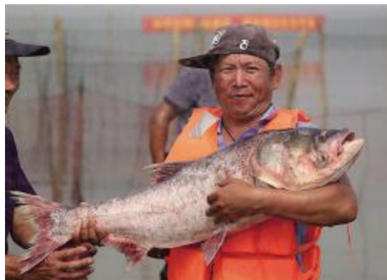
捕捞人员进行现场展示