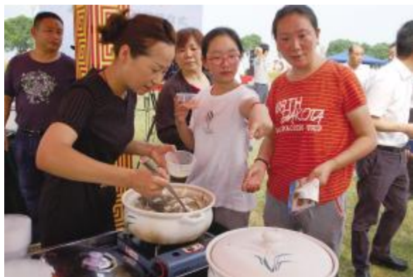
尝一尝长荡湖鱼的滋味