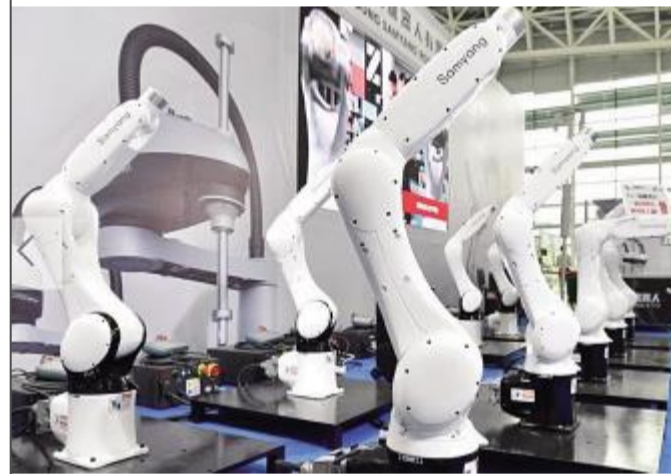
国内工业机器人制造企业集中亮相在广东佛山顺德区举办的第四届中国(广东)国际“互联网+”博览会。本届博览会设有“互联网+”前沿技术、数字化商业、数字化生活、创新创业、智能制造和机器人六大展区,汇集全球650多家知名工业、互联网企业的前沿技术和产品。