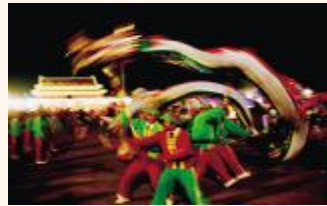
1999年,巨村舞龙在天安门庆祝澳门回归 王玉华

照片凝结历史,图像激励生活。它们是一幅幅静止的图像,也是一个鲜活故事的展现。它们是一帧帧凝结的瞬间,也是一段段漫长生活的延续。在这里,有金坛人的喜与乐,激情与感动,还有深深的联想。在这里,有金坛的往昔今年,也有颜色之外丰富的内涵以及艺术的匠心。这里,不仅仅是风景,还有变化、发展和进步——我们国家的,我们金坛的,我们每一个人和每一个家庭的。这里,不仅仅是摄影,还有心血、智慧以及艰辛和刻苦——摄影师的,被摄者的以及画面之外、认真生活的每一个人。本期配文图片由金坛摄影家协会提供,特此鸣谢。并向各位作者致敬。