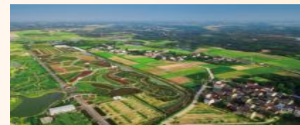
金坛,一片美丽的沃土,旧貌换新颜 王正祥