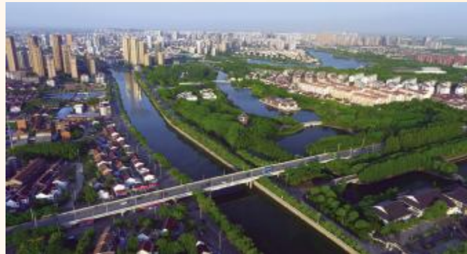
美丽新金坛,绿色、和谐、生机勃勃、活力充沛。 王正祥