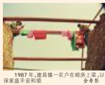
1987年,建昌镇一农户在棚房上梁,以保家庭平安和顺 金寿彰