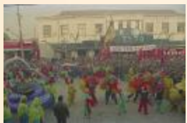
1993年,为庆祝撤县建市,民间团队与市民们在街头举行庆祝活动 金寿彰