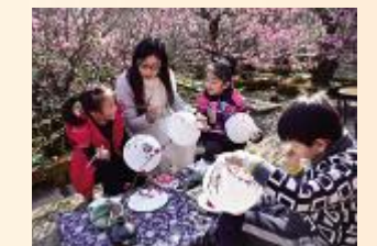
宜居宜业的新城——周末赏梅 金人亮