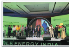
正信光伏 印度、澳大利亚订单量充足