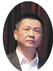
直溪镇党委书记 吴志高