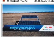
东方日升 组件和电池片面向国际国内 高端合作商

“砥砺奋进待秋实,苦干实干再出发”。2019,我承诺,攻坚在一线,吃苦在一线,以作风的高标准,落实的严要求,提升的好成效,向着十三五既定目标团结拼搏、共同奋进,以实际行动为全区发展做出直溪更多、更好的贡献!主动适应新形势,把握新机遇,围绕打造特色产业名镇,工业经济强镇的总体目标,以新理念引领新实践,以高质量保持高速度,以创新提升发展能级,继续以昂扬的状态、奋进的姿态,做强特色、做好载体、做优环境,确保全年各项工作任务圆满完成。