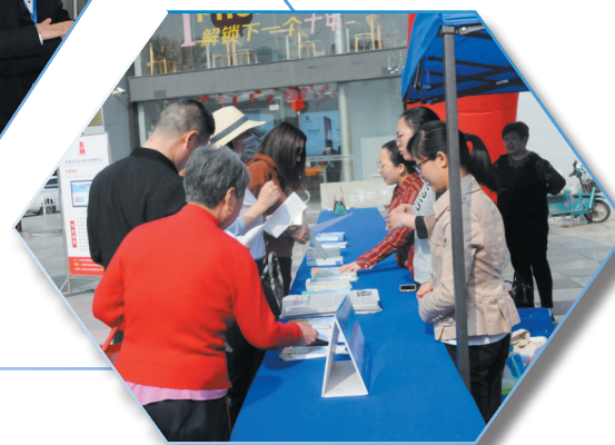
政策宣传及咨询解答