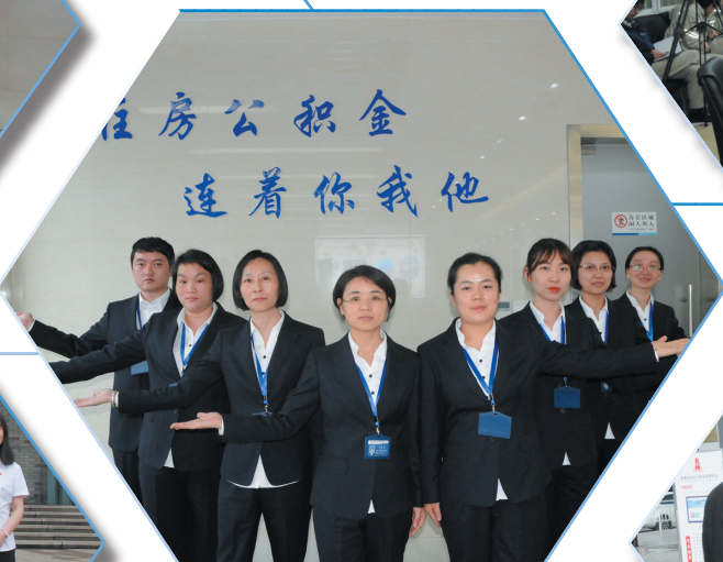
分中心服务大厅荣获“江苏省巾帼文明岗”荣誉称号