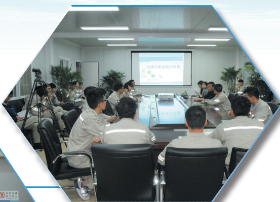
到企业开展上门服务