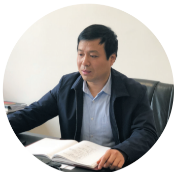
区住房和城乡建设局党委书记、局长 区人民防空办公室主任 陈建军