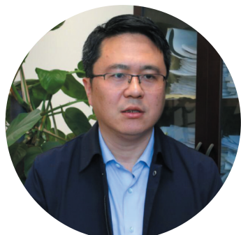
区水利局局长 陈俊