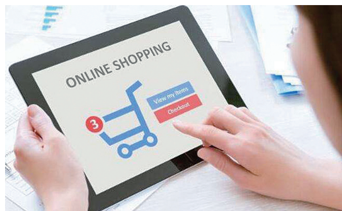
90后购物更精打细算,70、80后偏爱拼多多

记者从多家银行获悉,自4月1日起,如果客户留存的身份信息不完整、不真实,或者相关信息过期,银行将中止对该客户名下的账户提供金融服务。那么,身份证如果过期将会有哪些影响?如何更新在银行存留的身份信息?不能及时更新银行信息怎么办?针对这些问题,本期主持人为大家详细解答。