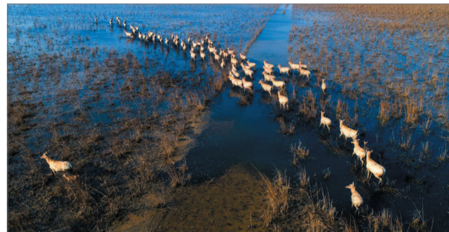
日前,一群麋鹿在盐城大丰黄海湿地麋鹿自然保护区觅食、嬉戏。每年3到5月是麋鹿繁殖期,该湿地麋鹿种群会集中在湿地滩涂活动,成群的麋鹿聚集在滩涂湿地觅食、嬉戏,构成一幅生机盎然的生态图画。