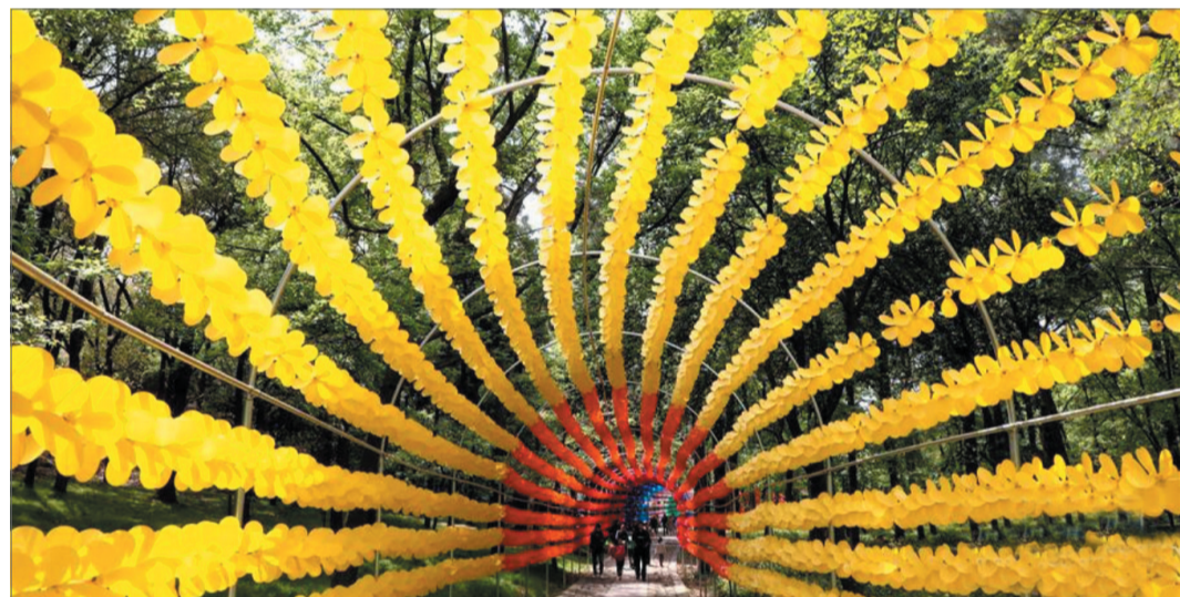
游人在苏州天平山景区“风车长廊”里观光游玩。