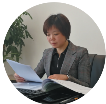
区统计局局长 钱永锋