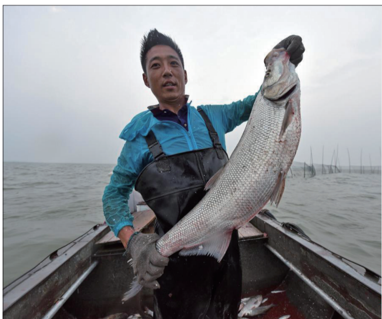
日前，宿迁市骆马湖结束了为期5个月的禁渔期，平静多月的湖面又热闹起来，今年渔民的捕捞产量和渔获物规格较往年有所增加。