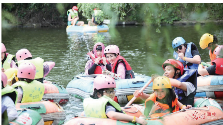
盛夏时节，游客在盱眙县铁山寺峡谷漂流游玩。此地的漂流运动受到游客青睐，纷纷前往降温防暑享受清凉。