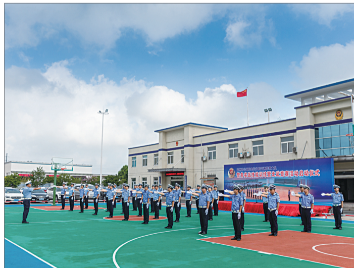
日前，我区公安交警部门警务实战技能训练暨比武竞赛活动启动。为认真贯彻习近平总书记“着力锻造一支‘四个铁一般’标准的公安铁军”重要指示，落实全区公安工作会议精神，持续深入推进常态化全警实战训练工作，交警部门启动了此次警务实战技能训练暨比武竞赛活动。活动确立“按实战去训练、按训练去实战”的指导思想，大力开展系统化教育、精准化培训、专业化训练，不断增强交警训练的针对性、实战性、实效性，全面提升交警队伍整体素质和实战本领。