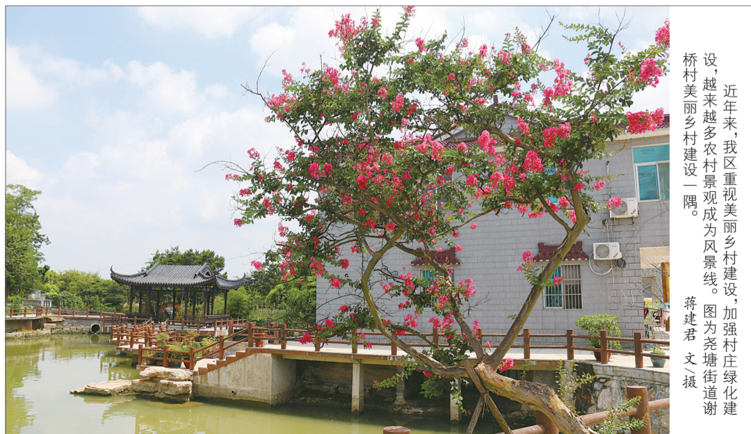
近年来,我区重视美丽乡村建设,加强村庄绿化建设,越来越多农村景观成为风景线。图为尧塘街道谢村美丽乡村建设一隅。

(上接第一版)放大山水资源优势,提升公共服务水平,打造长三角生态绿色宜居城。坚持生态保护优先,打好蓝天碧水净土保卫战。坚持在保护中开发、在开发中保护,打造茅山、长荡湖生态旅游新亮点。大力引进上海优质教育、医疗资源,支持河海大学建设医学院,全面打响金坛教育、金坛医疗品牌。以生态绿色宜居城建设的成效,让人民群众享有高品质生活,也增强对各类人才的吸引力和吸附力。