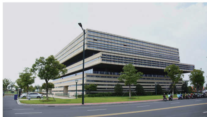
图为金坛图书馆(新馆)

2017年12月29日，金坛图书馆(新馆)正式开馆，这是一座具有人文唯美、开放共享、绿色生态、科技智慧特点的第三代公共图书馆，总建筑面积1.55万平方米，目前馆藏图书65万册(远期馆藏图书100万册)，可同时为1000名以上读者提供服务。