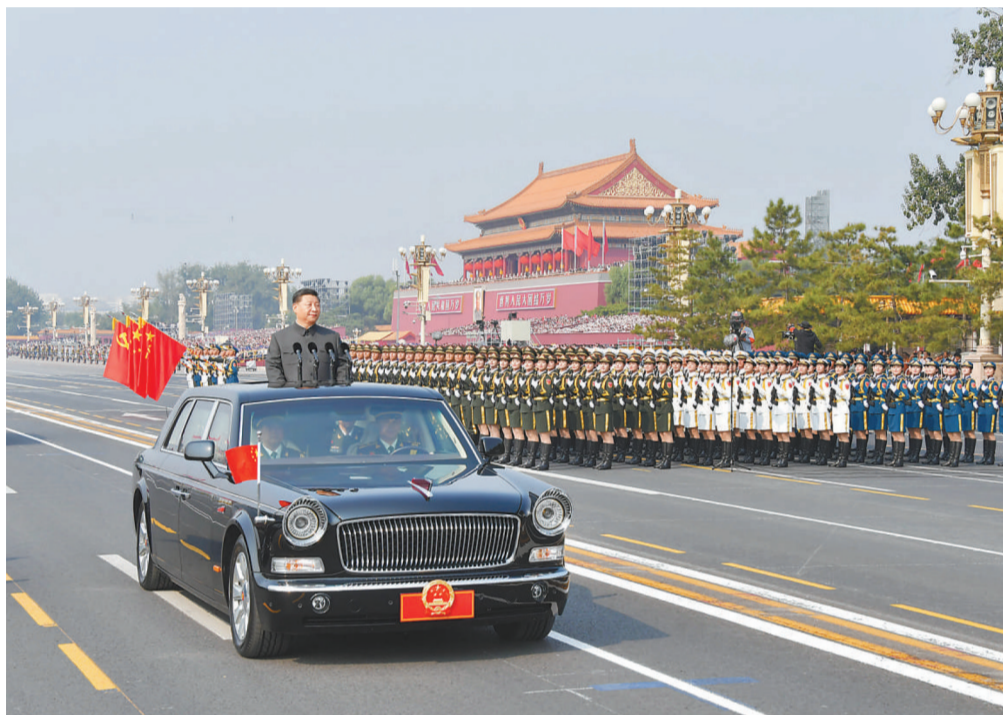
10月1日,庆祝中华人民共和国成立70周年大会在北京天安门广场隆重举行。这是中共中央总书记、国家主席、中央军委主席习近平检阅受阅部队。

新华社北京10月1日电 壮阔七十载,奋进新时代。10月1日上午,庆祝中华人民共和国成立70周年大会在北京天安门广场隆重举行,20余万军民以盛大的阅兵仪式和群众游行欢庆共和国70华诞。中共中央总书记、国家主席、中央军委主席习近平发表重要讲话并检阅受阅部队。