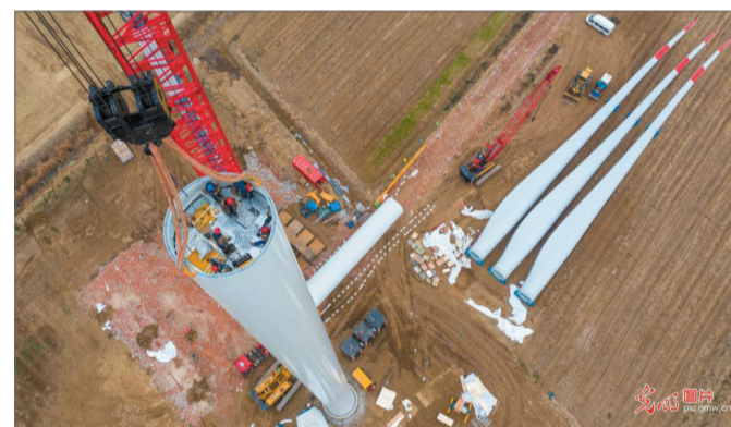
日前，宿迁市泗洪县引进的脱贫攻坚项目——风电场，进入塔筒吊装阶段，工人正在上塘镇区域紧张施工。