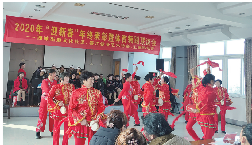
文化社区组织社区居民开展舞蹈、歌曲等新春联欢活动