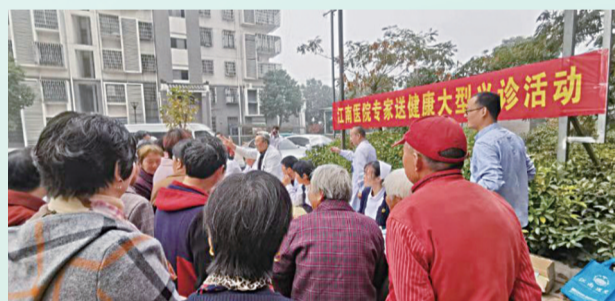
江南医院送健康大型义诊活动

讲解;对于一些村民患有的一些无法真正治愈的退行性老年病,专家们也会给出缓解病痛的方法。江南医院的专家们专业的回答与热情的服务,换来了村民们的交口称赞与声声感谢。对于专家团队的每一位医生来说,这一句句肯定与一声声感谢,比秋日暖阳更让人窝心。作为一家定位为高级专家型综合医院的医疗服务机构,常州江南医院以“一流的专家、一流的设备、一流的技术、一流的服务”为特色,但这一特色并没有让医院变得高高在上,它还是扎根于普通百姓,还是很接地气,还是在“努力缩短普通百姓与高级医疗专家的距离,促进公平就医”的道路上不断前行!