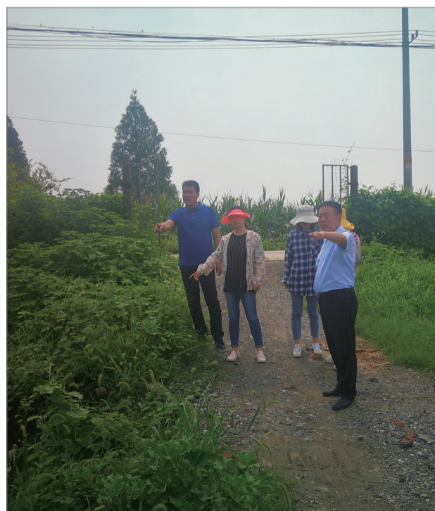
局镇领导现场调研

我区高度重视全域土地综合整治试点工作,早在1月6日,区自然资源和规划局就呈报试点申请,并结合区委、区政府关于建设黄金软米生态大农场决策部署,深入朱林镇开展调查摸底,初步拟定朱林镇黄金村、红旗圩村2个行政村开展全域土地综合整治试点工作。3月19日,经常州市自然资源和规划局现场考察走访和调研指导,最终选定朱林镇黄金村、红旗圩村为我区全域土地综合整治试点镇、村。3月24日,区自然资源和规划局技术支撑单位围绕整治区域开展驻点走访、资料搜集、座谈调研等,结合朱林镇、黄金村、红旗圩村等干群意见建议,经多轮商讨目前试点方案大纲初步形成。