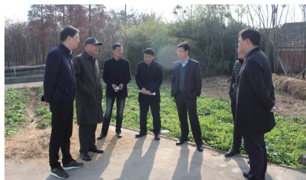
常州市局领导现场调研

土地综合整治是贯彻习近平生态文明思想、实施乡村振兴战略重要手段,履行自然资源部统一行使所有国土空间用途管制和生态保护修复职责、实施国土空间规划的平台抓手。全域土地综合整治以科学规划为前提,以乡镇为基本实施单元,整体开展农用地、建设用地整理和乡村生态保护修复等,对闲置、利用低效、生态退化及环境破坏的区域实施国土空间综合治理的活动。按照山水林田湖草整体保护、系统修复、综合治理要求,结合农村人居环境整治,优化调整生态用地布局,保护和恢复乡村生态功能,维护生物多样性,提高防御自然灾害能力,确保整治区域内耕地质量和数量提升。