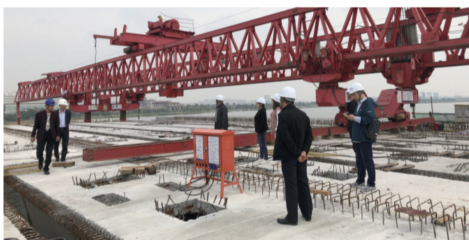
钱资湖大桥施工现场办公