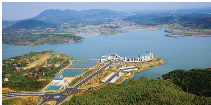
矿山保护成果中的茅东水库

两个加快持续发力，经济持续稳健发展，其中资源保障发挥重要作用。区自然资源和规划局以超常之力破瓶颈，以决战之势强保障，以从严之举严执法，以领跑之姿敢担当，让勇争一流成为最亮标识。简化业务材料、再造服务流程，“刀刀向内，自我革命”需要何等的勇气？有效解决企业行政审批和规划建设痛点、堵点和难点，让企业感受到贴心服务、金坛是投资兴业“热土”，“项目为王，服务至上”需要何等智慧？跳出部门看差距，跳出金坛看不足，补齐短板争上游，在关键问题上敢发声，在困难中敢动真碰硬，“勇立潮头，争创一流”需要何等远见卓识？他们是资源节约和两个加快的“领跑者”。