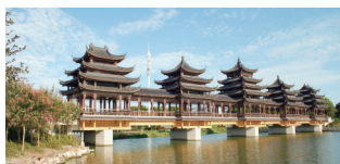
愚池湾国家水利风景区