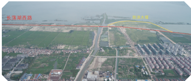
防洪大堤建成后