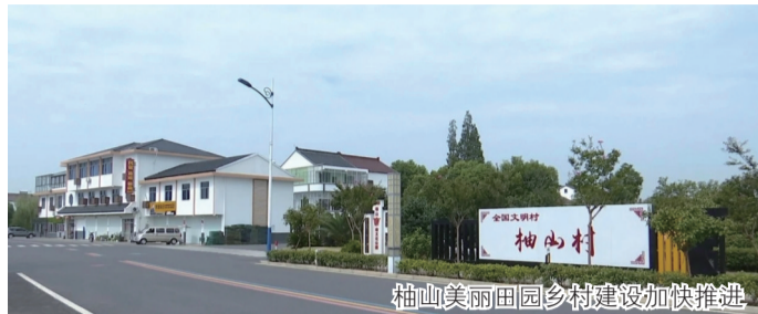
柚山美丽田园乡村建设加快推进

出,要坚守底线,防范风险。儒林镇务实举措,将重点围绕招商会、安全会、维稳会、财税金融会、农业农村会、干部建设会,组织好镇村干部进行思想大交流,持续开展“一学习两整治”活动,配套出台《儒林镇党委议事决策规则》、《镇村工作人员管理制度》等,做强镇村干部队伍。做亮“儒林在线”品